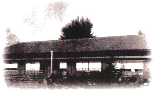
大正末期の学寮宿舎

これまでの卒業生の数は1,500人を越えており、官界、実業界、学界、報道出版関係と各方面で活躍しております。